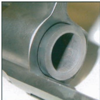
Før: Revolver pusset med et veldig kjent rengjøringsmiddel