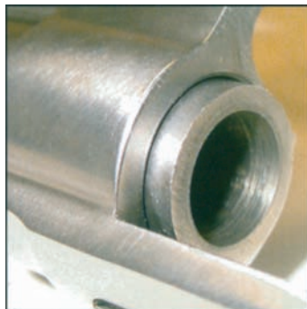
Etter: Den samme revolveren er nå pusset med Hoppe's Elite Gun Cleaner